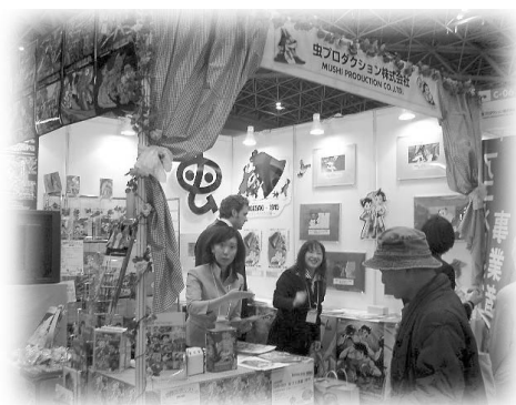
メインストリートの一角を占めた虫プロブース

ビジネスデー（商談日）には、ヨーロッパ、アジア、アメリカ等から多くのバイヤーが訪れ、「NAGASAKI・1945～アンゼラスの鐘～」にも関心が集り、英文のチラシやトレーラー（動画）を見せてほしいとの要望が多く寄せられ、海外の配給などについても質問が及ぶなど、予想外の反応に当の虫プロや関係者の方が驚いています。